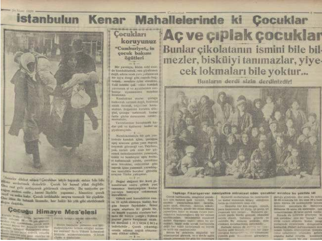
Görsel 1. “İstanbul’un Kenar Mahallelerindeki Çocuklar” 84

Gazete, pek çok haberde kimsesiz çocuklara yer vermiştir. Anne-babaların kabahatlerinin bu çocuklara yüklenemeyeceği söylenerek toplumun bu çocuklara bakmaya mecbur olduğuna işaret edilmiştir 85 . Çocuklarla ilgili bir başka mesele fuhşa düşen kız çocuklarının kurtarılması meselesidir. Mümtaz Faik’in bir yazısında fuhşa düşen kız çocuklarını kurtarmanın vazife olduğuna dikkat çekilmiş, kız çocuklarının kurtarılması için islahahaneler kurulması gerektiği ve bunun devletin vazifesi olduğu vurgulanmıştır 86 .