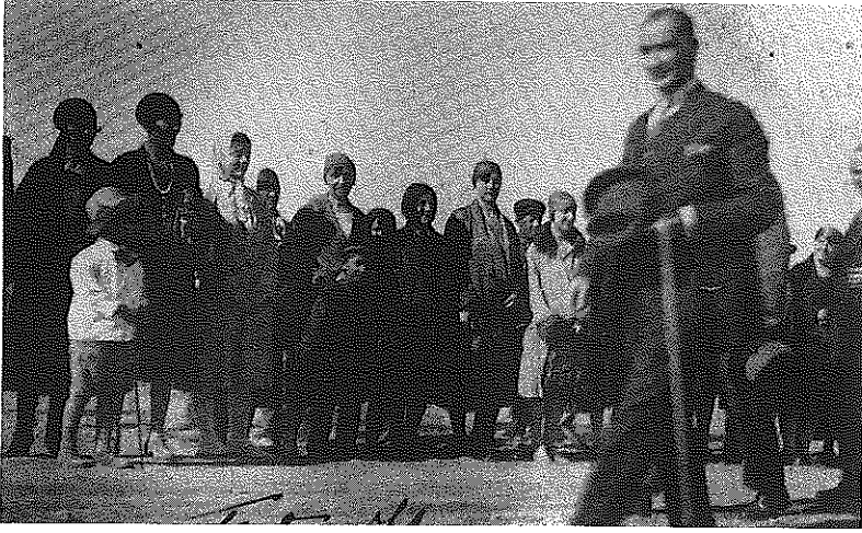
(Atatürk'ün Kayseri gezisi)