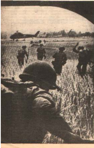
Türk topraklarında Amerikalı askerleri, Türk sivilizasyonunu tahribatından koruyabilmeleri için yaptıkları işler

Yukarıda yayınlanan listenin birinci kolonunda tesislerin numaraları