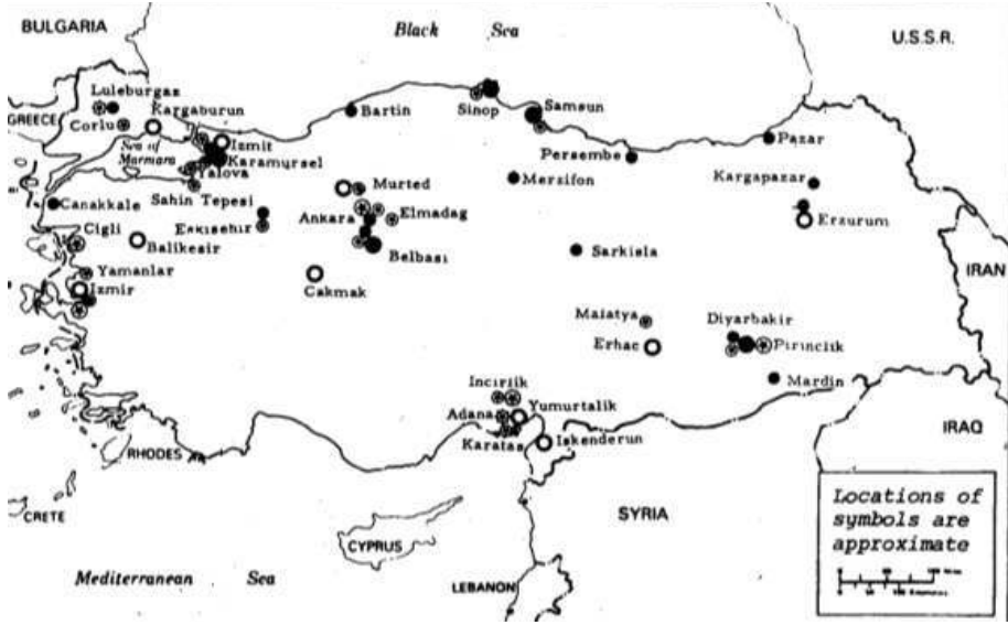
Ek-2: Türkiye'deki ABD Üs ve Tesislerinin Haritası (1980) 106