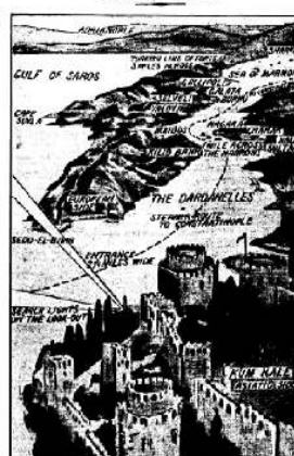
THE BOMBARDMENT OF THE DARDANELLES.