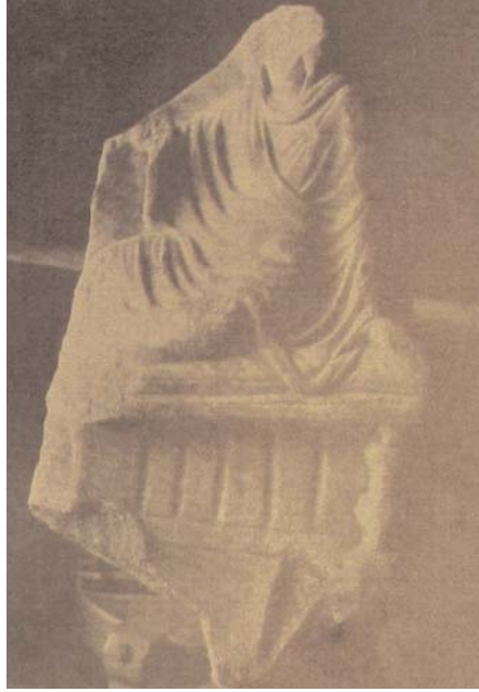
Resim 4: Kırık başlı rölyef