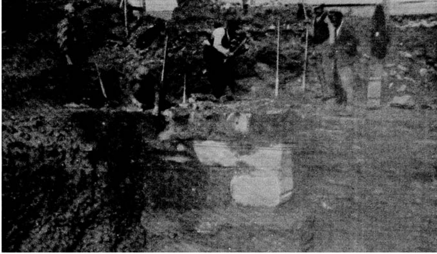
Resim 1: Türkler tarafından duvar enkazı olarak kullanılan yapı