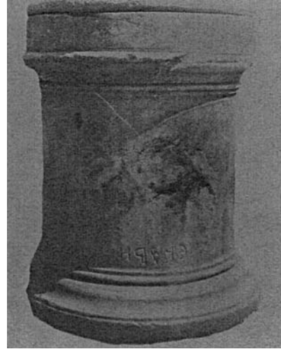
Resim 5: Hecuba heykelinin kaidesi*