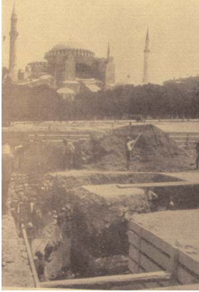
Resim 6: Zeuxippos Hamamı