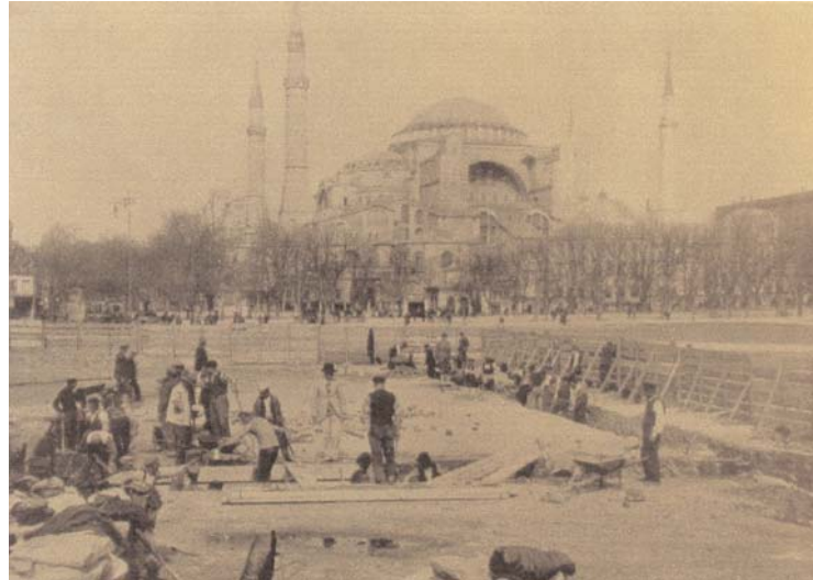
Resim 10: 1928 yılında Zeuksip Hamamı civarında yapılan kazı çalışması