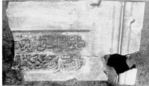
Resim 3: Üçler Camii Kitabesi