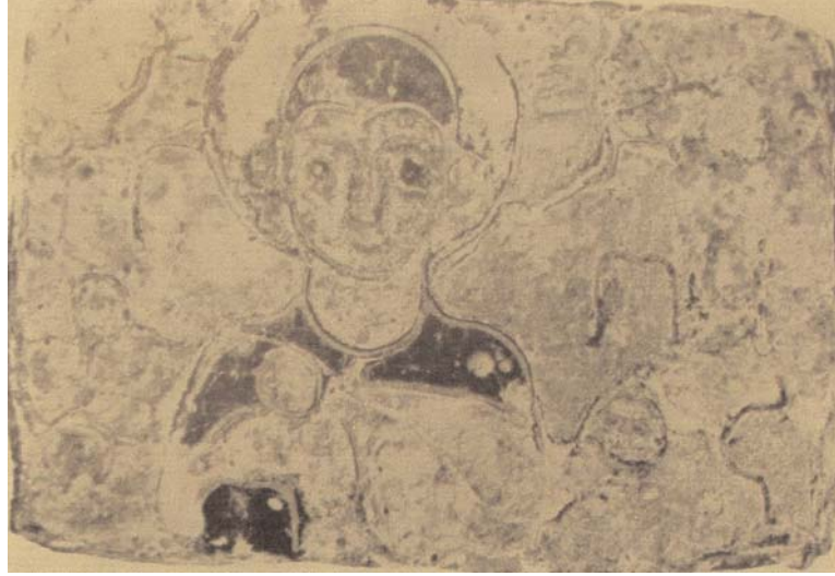
Resim 9: Aziz Procopius'u tasvir eden altın varaklı minyattür