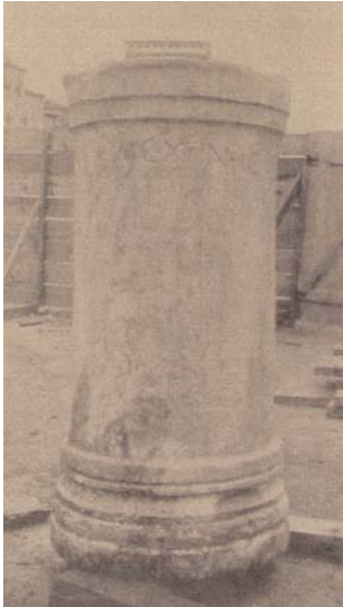
Resim 8: Aeschines heykelinin kaidesi