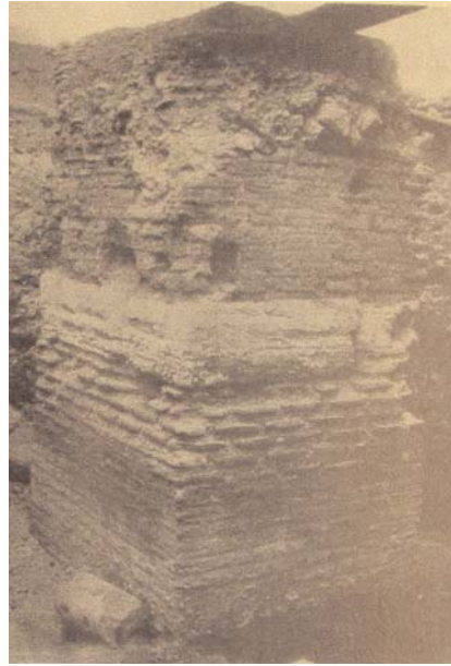
Resim 7: Zeuxippos Hamamına ait sütun