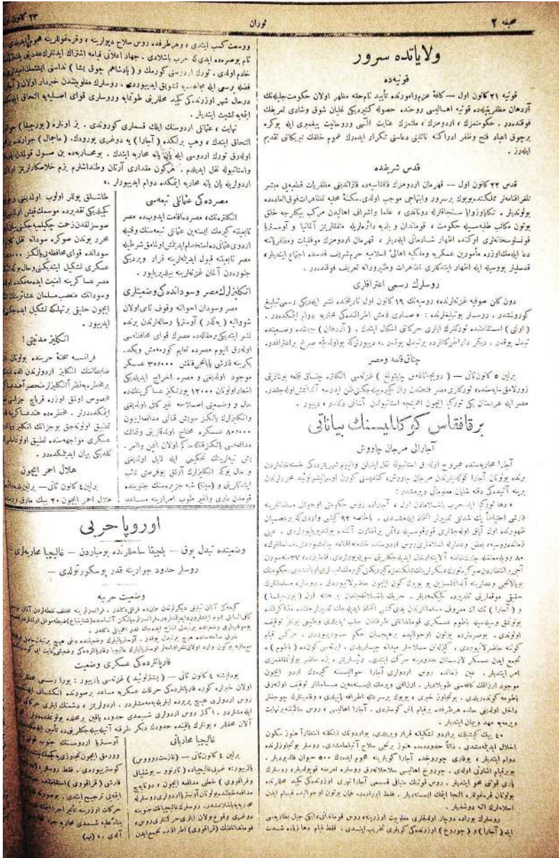
Ruslara karşı savaşırken yaralanan bir Kafkas gönüllüsünün İstanbul basınında bir Ruslara karşı açıklaması [Turan, 23 Kânunuevvel 330 (5 Ocak 1915)]