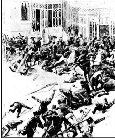
21 Temmuz 1905'te Sultan Abdülhamid'e Düzenlenen Yıldız Suikasti 18 .

Bir ara bomba atılmasından vazgeçildi. Çünkü Padişah'ın geçtiği yollara kum dökülmekteydi ve bomba infilak etmeyebilirdi. Ancak Kristapor'un vazgeçmeye niyeti yoktu. Kumda infilak edebilecek bir bomba imal etmeye karar verdi. Bu işte mahir bir Ermeni usta da buldu. Ne var ki, 50 lira karşılığı bomba yapmayı kabul eden bu usta, bombanın Abdülhamid'e karşı kullanılacağını öğrenince bir anda ortadan kayboldu 19 . Bu defa suikasta kesin kararlı görünen komite, Ramazan ayının 15. günü yapılacak törende, yol üzerinde mevzilenen iki kişinin padişaha tabancalarla saldırmasını planladı. Ancak kararlaştırılan günde padişahın, Çırağan Sarayı'na kadar Yıldız bahçesinden geçerek gitmesi, komitecilerin teşebbüsünü bir kez daha neticesiz bıraktı 20 .