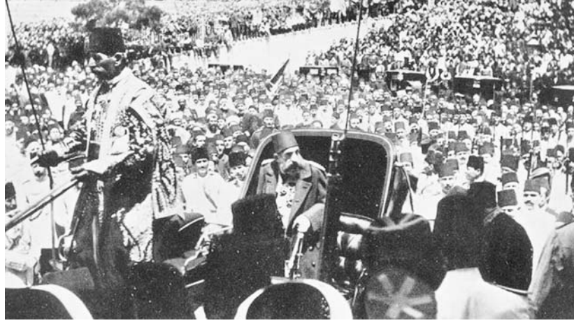
Sultan Abdülhamid bir cuma selamlığından Saray'a dönerken. 33

Nihayet Padişah'ın camiden dönüşü haberiyle arabası binek taşı önüne getirilmişti. İşte tam bu anda cuma namazı bitip cemaatle birlikte Padişah da çıkmaya başlayınca, saat ayarlı bomba patlamıştı, ama ortalıkta Sultan Abdülhamid yoktu. Buna sebep, Sultan'ın camiden çıkarken, âdetten olmadığı halde Şeyhülislâm Cemalettin Efendi'yle birkaç dakika konuşması idi 34 . Padişahın camiden çıkacağı dakikaya göre ayarlanmış olan bomba, tam bu sırada patlayarak, bu bir anlık gecikme, Sultan'ı ölümden kurtarmıştı 35 . Yoksa bombanın saati doğru olarak ayarlanmıştı. Hemen bütün kaynaklarda bu bir anlık gecikmenin (Şair Fikret'in deyişiyle, bir lahza-i teahhur'un) sebebini Padişah'ın Cemaleddin Efendi'yle biraz daha sohbet etmek istemesinden kaynaklandığı belirtilmektedir. Ancak devrin Sadrazamı Avlonyalı Ferid Paşa'nın oğlu Celalaeddin Velora Paşa'nın bizzat babasından naklettiğine göre, Şeyhülislam, o sırada İstanbul'a gelmiş bulunan Mekke Emiri'ni getirmiş ve namazdan sonra Padişah'a bu uğurlu misafiri