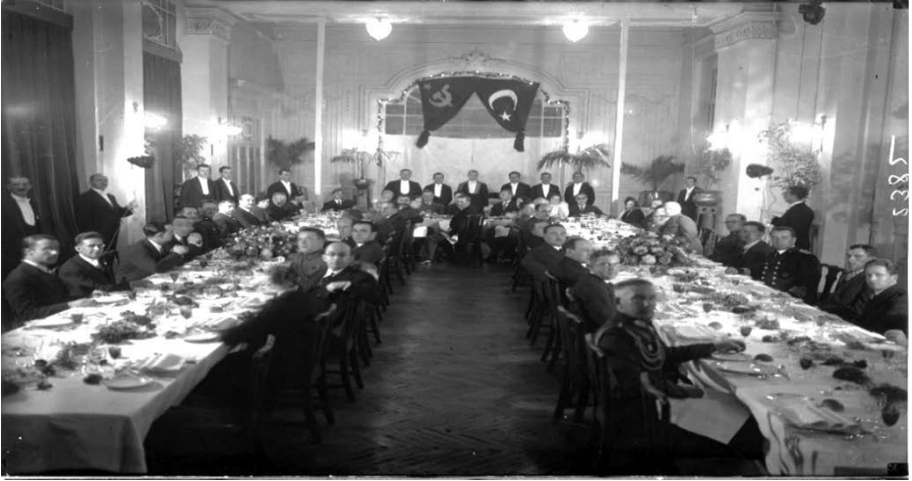
TİTE Arşivi FK34G21B21-1001