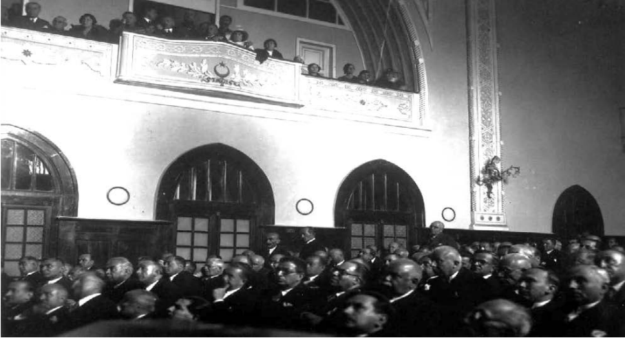
TİTE Arşivi K8G57B57001