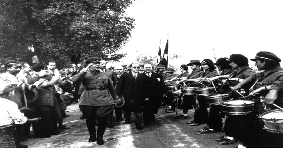
TİTE Arşivi FK29G60B60001