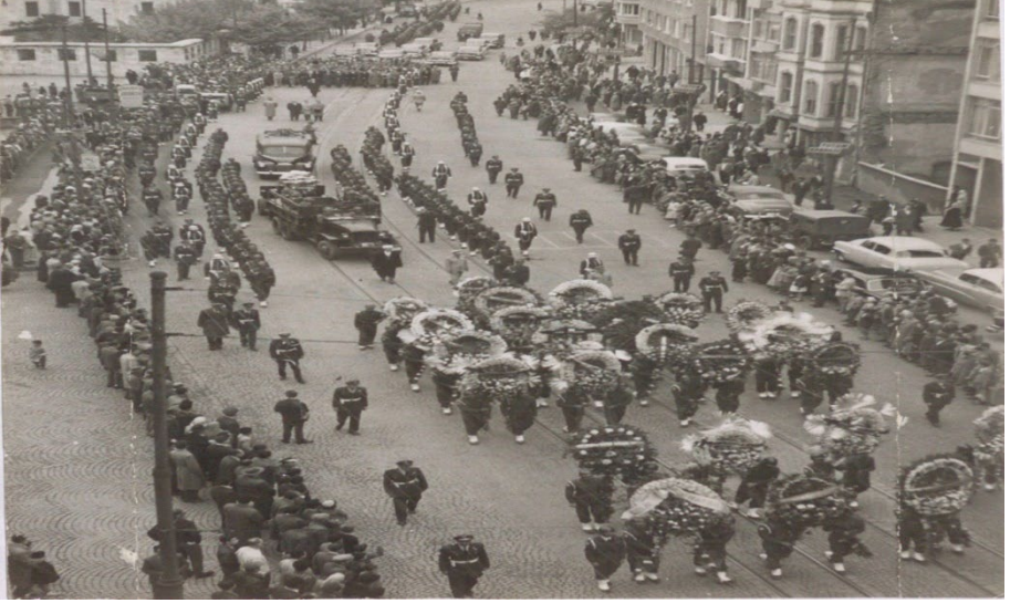
Ek-7. Anderiman Çiftinin Naaşları Şişli Camiinden Kaldırılırken (11 Ekim 1959).