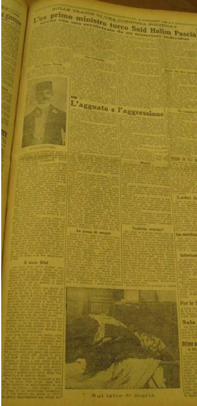
Görsel 2. Il Messaggero (07.12.1921)