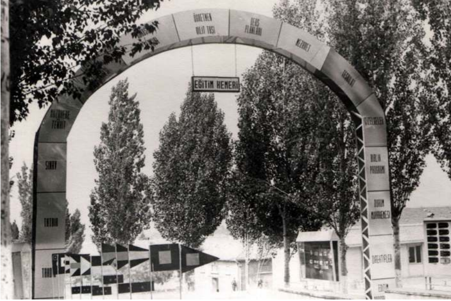
Ek-3. Çanakkale Jandarma Er Eğitim Alayı (1980'li yıllar).