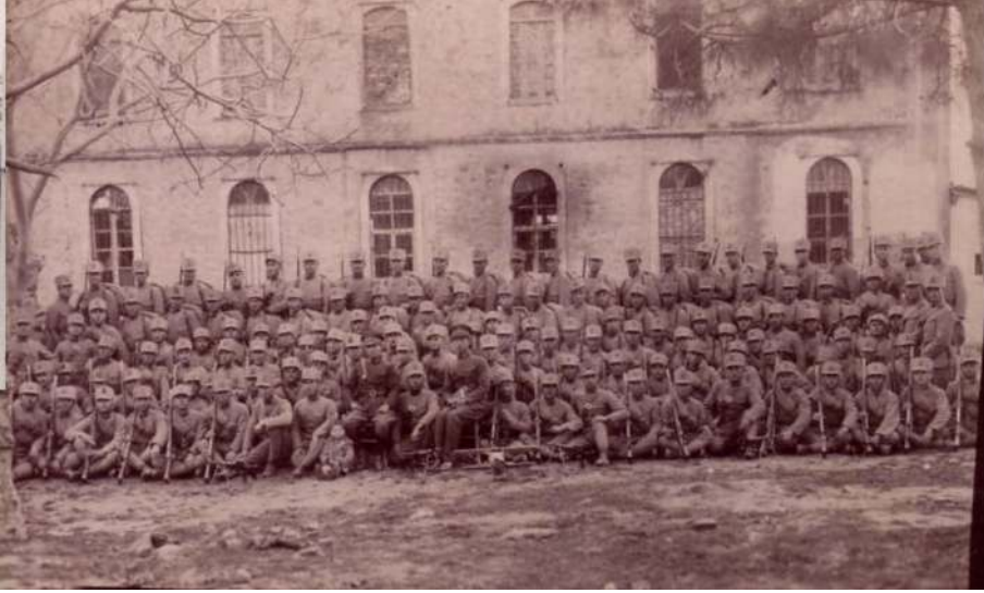
Ek-7. Silvan Jandarma Okuma Yazma Okulu Eğitimi Gören Erler ( Jandarma Genel Komutanlığı 50 Yıl Cumhuriyetin Hizmetinde , Jandarma Genel Komutanlığı, Ankara 1973).