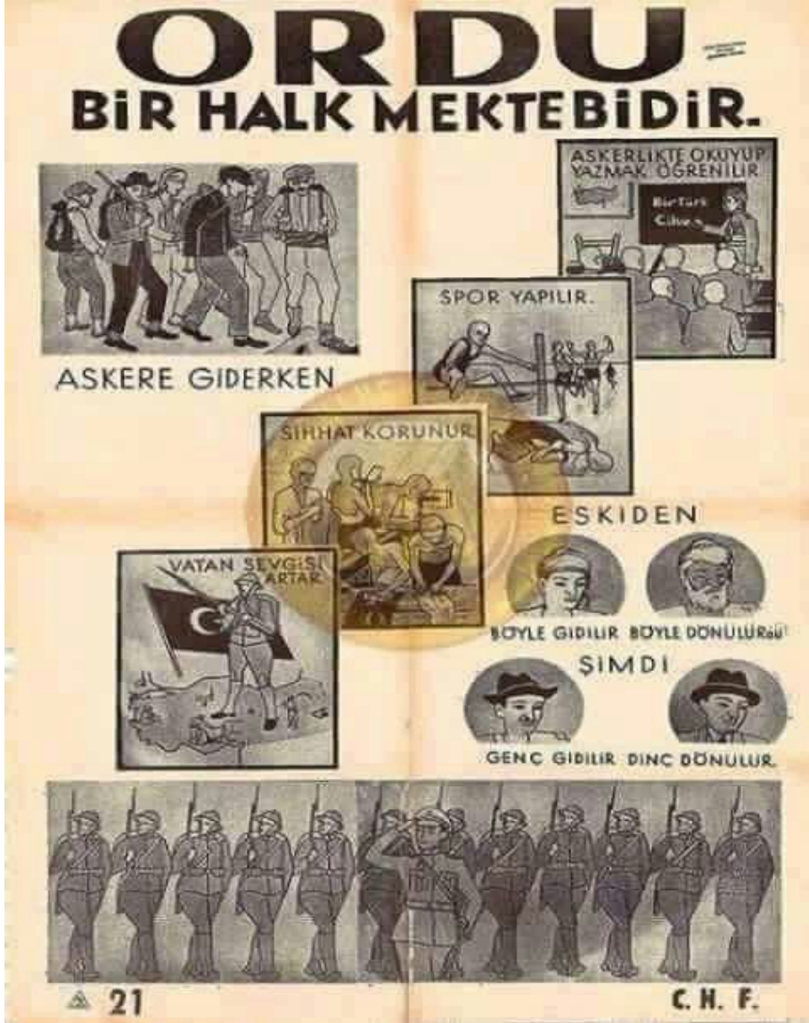
Ek-1. 1930'lu Yıllar Cumhuriyet Halk Fırkası (CHF) Propaganda Afişi.