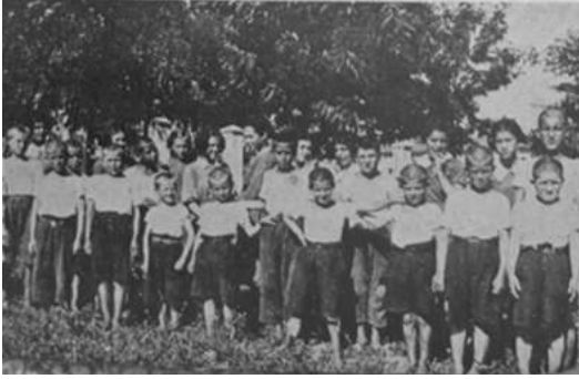
Karaağaç Azat Obası (Edirne)