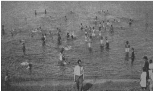
Maydos Azat Obası (Çanakkale)