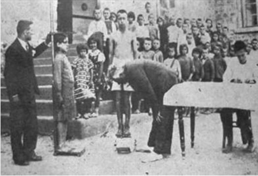
Sergen Azat Obası (Kırklareli)