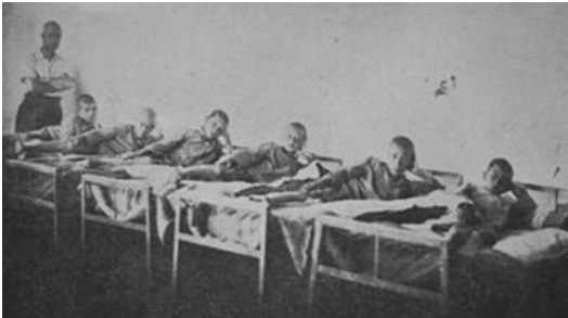
Çavuşköy Azat Obası (Çanakkale-Biga)

Kaynak: Trakya Umumi Müfettişliği Köy Bürosu, Trakya'da Azad Obaları , İstanbul: Ahmed İhsan Basımevi, 1939.