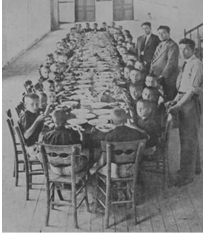
Saray Azat Obası (Tekirdağ)