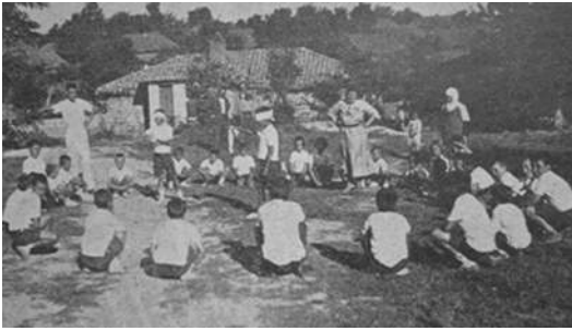
Velimeşe Azat Obası (Tekirdağ)