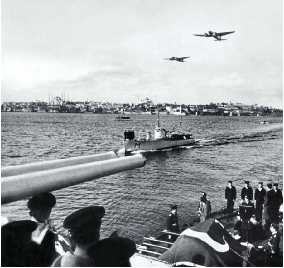
Ek 2: Ulu Önder ATATÜRK'ün Naaşının Donanma Tarafından 19 Kasım 1938 tarihinde İstanbul'dan İzmit'e Götürülmesine Ait Fotoğraf (Deniz Kuvvetleri Komutanlığı Foto Film Arşivi)