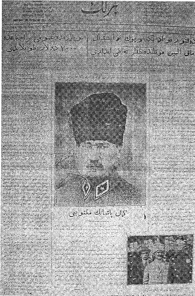
Ek 1: Birlik Gazetesinin Bir Nüshasının Baş Sayfası