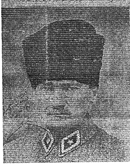
Ek 2: Atatürk'ün Türk Teavün Cemiyeti'ne Hediye Ettiği İmzalı Fotoğrafı