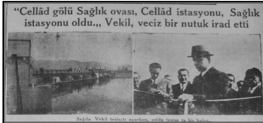
Anadolu Gazetesi, 28 Mart 1940