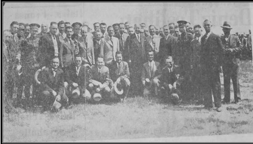
Cellât Gölü'nün Kurutulması Çalışmalarına Başlanması Nedeniyle Düzenlenen Törene Katılanlar (Yeni Asır, 29 Nisan 1935)