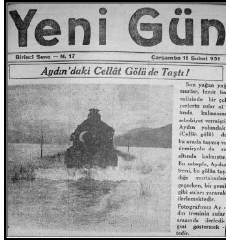
Yeni Gün, 11 Şubat 1931