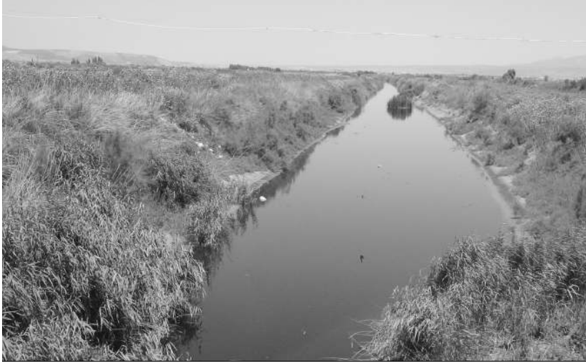
Cellât Gölü'nün kurutulması için açılan kanalın günümüzdeki durumu