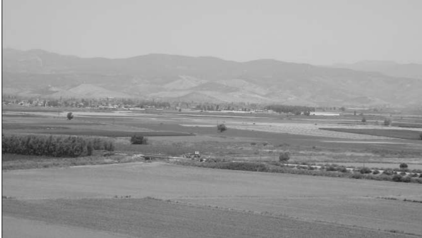
Cellât Gölü'nün kurutulmasıyla elde edilen "Sağlık Ovası"