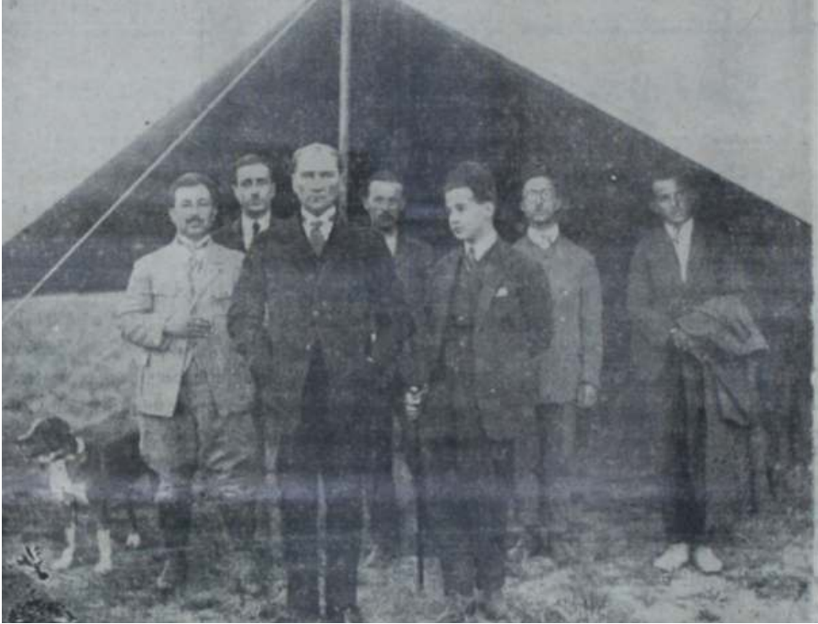
Çiftlikte Hiçbir Yapı Yokken Çadır Önünde Atatürk ve Birlikte Çalışanlar, Ulus Gazetesi, Orman Çiftliği On Birinci Yılına Girdi, 15 Mayıs 1935