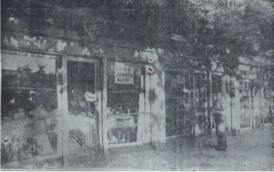
Çiftlik Lokantasının Dış Görüntüsü, Ulus Gazetesi, Orman Çiftliğinin Ankara'ya Yeni Bir Hizmeti, 3 Temmuz 1935