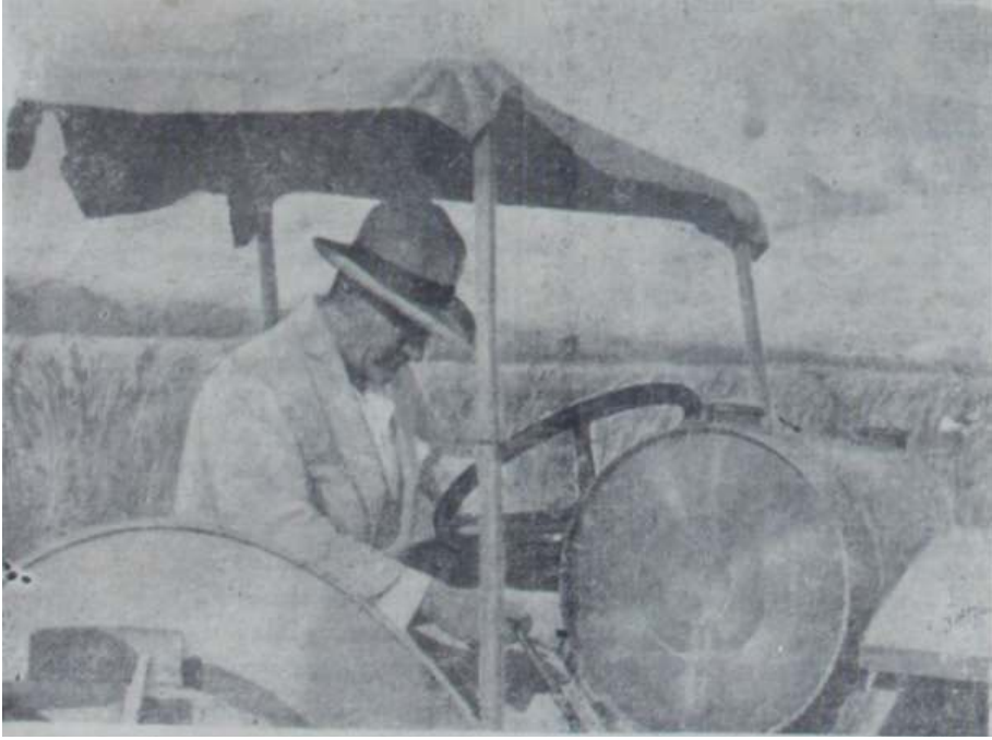
Atatürk Traktör Üzerinde Çalışıyor, Ulus Gazetesi, Orman Çiftliği On birinci Yılına Girdi, 15 Mayıs 1935