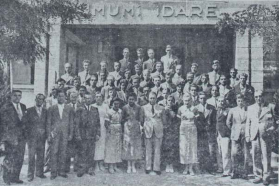
Orman Çiftliğinde Staj Gören Öğrenciler, Ulus Gazetesi, Orman Çiftliğinde Staj Gören Öğrenciler, 18 Ağustos 1935