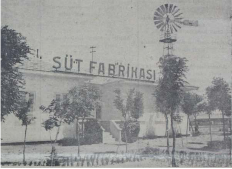
Süt Fabrikası, Ulus Gazetesi, Orman Çiftliğinin Yeni Eseri, 30 Ağustos 1936