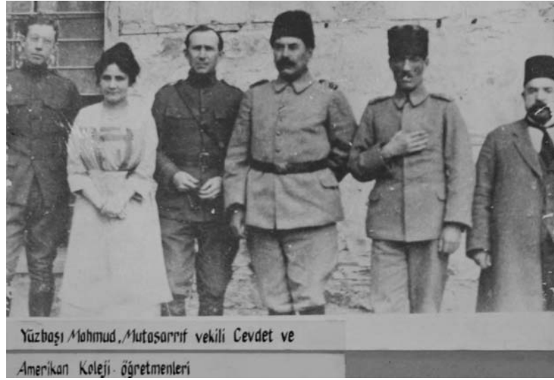
Ek III: Amerikan Koleji Öğretmenlerinin Bazı Türk Askerleri ile Çektirdikleri Fotoğraf.