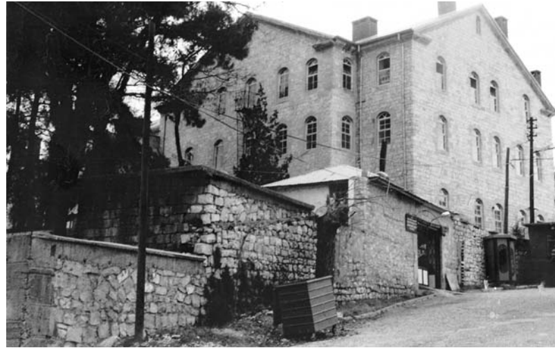
Ek IV: Avrupai tarzda inşa edilmiş olan Amerikan Binasının Bugünkü Görüntüsü.