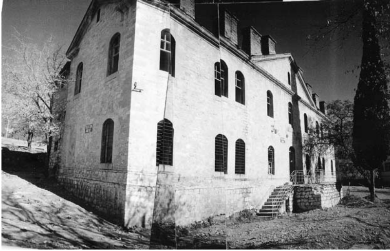
Ek VII: İngiliz Okulu'nun Bugünkü Görüntüsü.