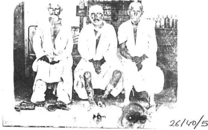
Ek 4: Sivashlı Manok ve Çetesinin Müslüman Köylere Baskınları (DH. ŞFR., 74/72).